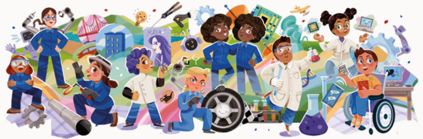
Mural de "el cole de los oficios" ↑