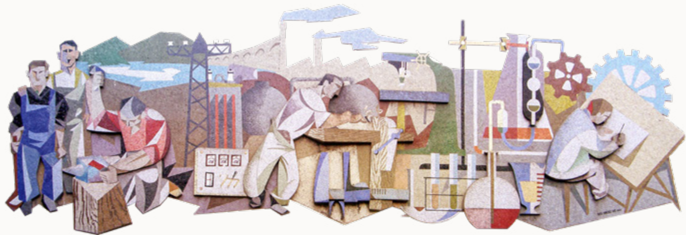
↑ Mural realizado por Suco-Sánchez Luis en 1960, y que ha servido como inspiración para este libro.